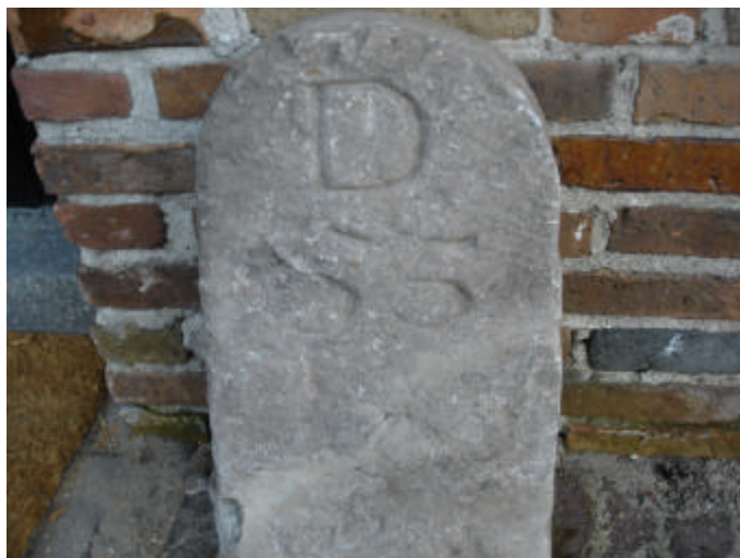
De steen met de aanduiding D55