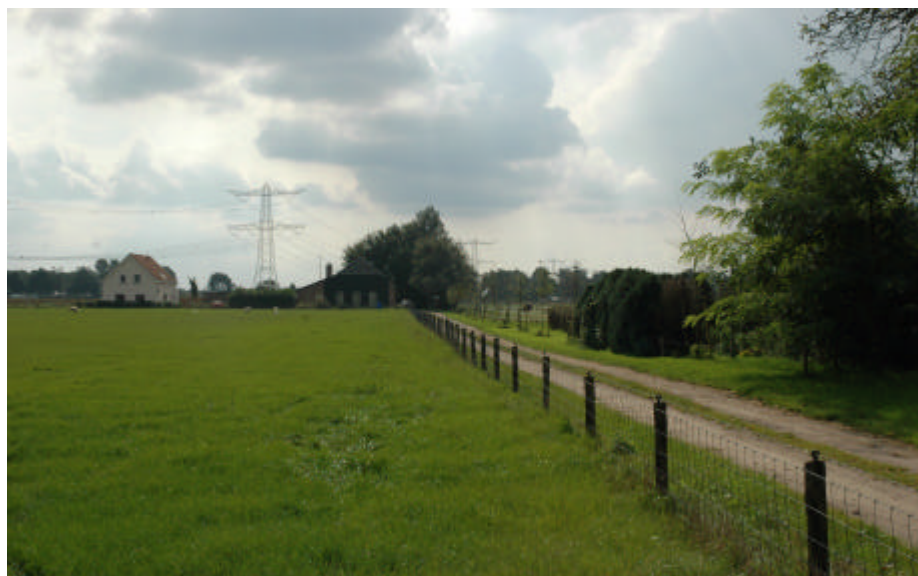
Geen plaats voor buitengebied in beschermd dorpsgezicht Den Hout?

Den Hout - De discussie over het beschermd dorpsgezicht voor Den Hout lijkt nu – na de leefbaarheidswerkgroepvergadering van september waar dit onderwerp op de agenda stond – eerst goed los te komen. De discussie richt zich daarbij op twee aspecten. Op de eerste plaats gaat het over de inhoud en de betekenis van de status beschermd dorpsgezicht. Met andere woorden wat mag nog wel en wat mag niet meer met een pand in de beschermde zone? En welke procedures en wellicht andere beperkende regels zijn van toepassing? De tweede discussie speelt zich af rond de vraag of het aangewezen gebied wel groot genoeg is om het doel van het beschermd dorpsgezicht – Den Hout voldoende vrijwaren van de te dicht naderende bebouwing van Oosterhout-stad – te bereiken.